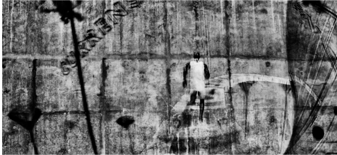
In deze MAGGEZIEN de complexe realiteit van het geheimzinnige landschap dat de straat kan zijn.

Mijn inspratiebron was de grootschalige tentoonstelling FAKE ME HARD betreffende overleven in de post-waarheidsmaatschappij. Betrouwbaarheid heeft van doen met waarheid. Niet altijd is de waarheid het uitgangspunt van beleid en het handelen van degene die bepalend (kunnen) zijn voor onze samenleving. Daar waar dat niet meer aan de orde is, verliezen we ons in een fake-samenleving. Onder andere heeft het presidentschap van Trump ons op de desastreuze gevolgen hiervan gewezen. Het lijkt dat het als virus in de aderen van onze samenleving heeft voortgeplant.