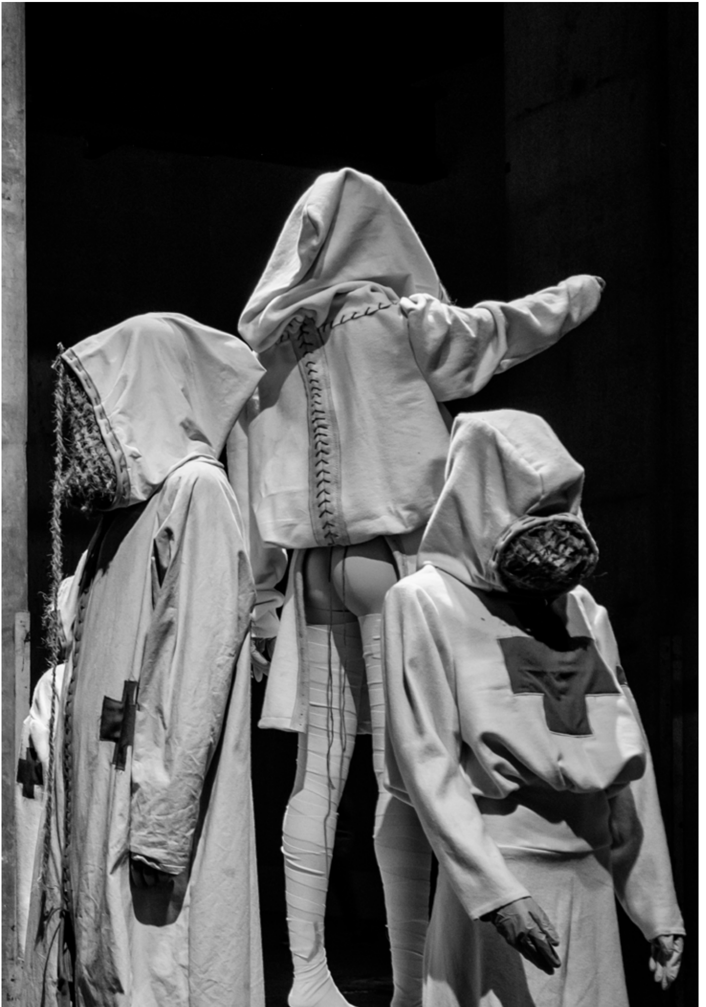
MAGGEZIEN | FOTOGRAFIE PETER VAN TUIJL | 2023 | 07